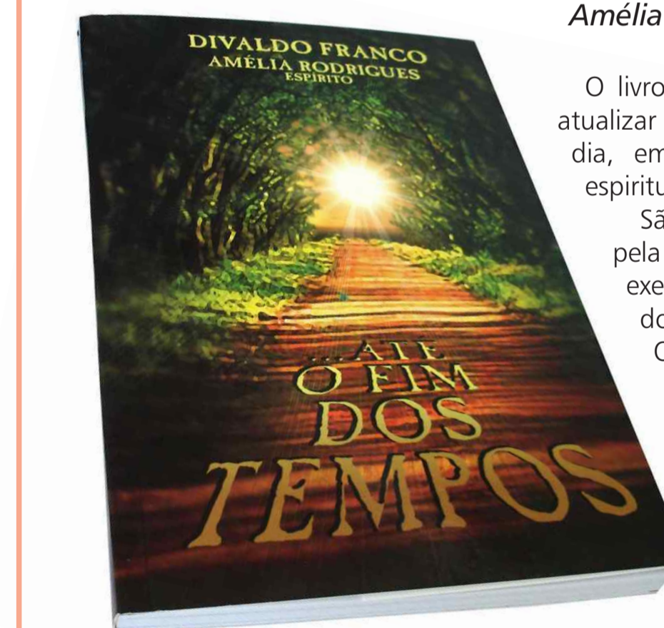
...Até o fim dos tempos – pelo espírito de Amélia Rodrigues, psicografado por Divaldo Pereira Franco, Livraria Espírita Alvorada Editora, 3ª edição, Salvador – BA, 2000, 14x21cm, 159 págs., na livraria da Comunhão – R$ 18,00.