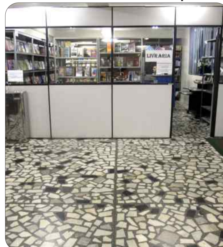
Posto localiza-se na entrada do auditório Bezerra de Menezes