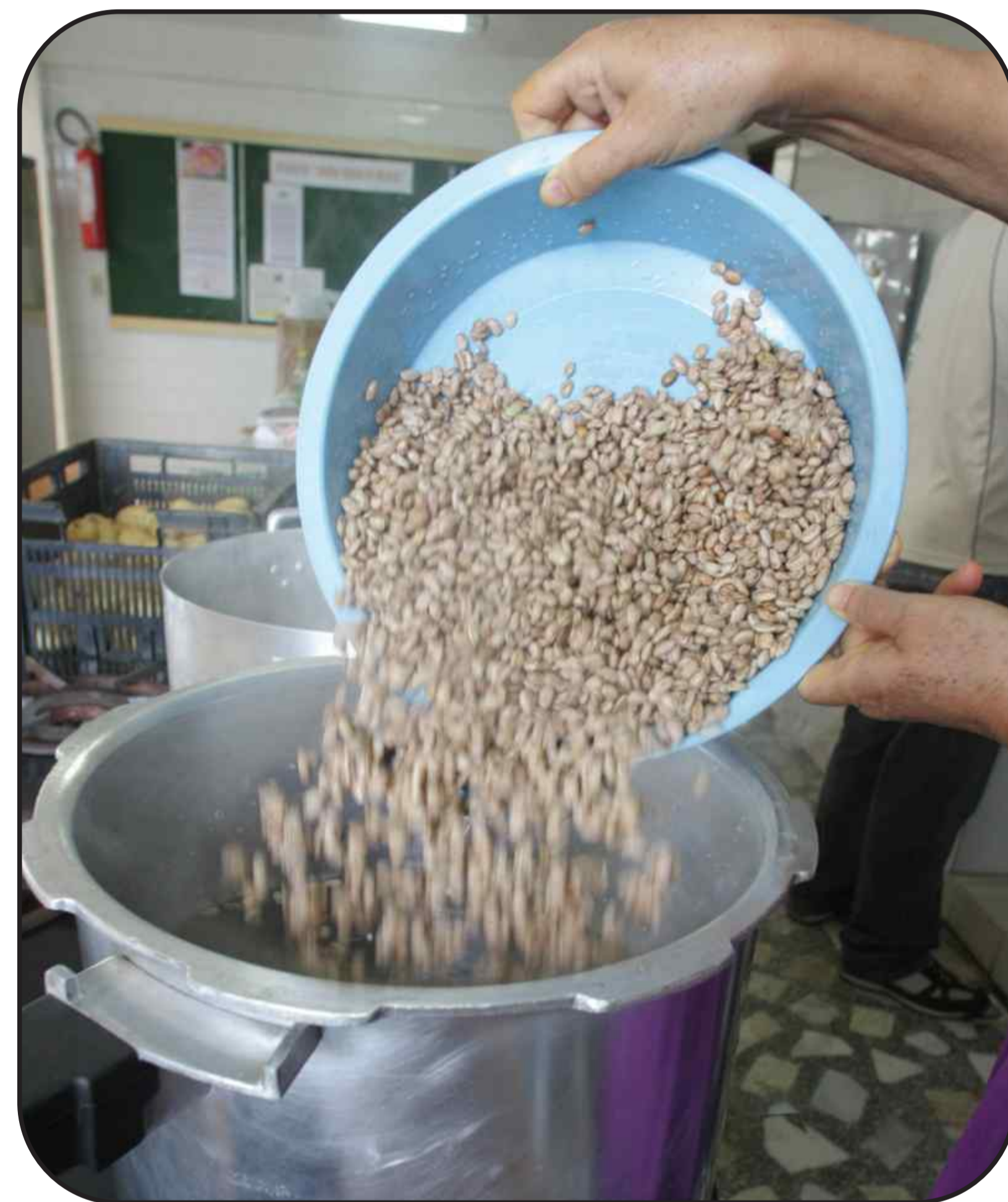
As refeições são preparadas na cozinha da própria Comunhão, nas noites das segundas-feiras, por meio da devoção de dezenas de voluntários

A Diretoria de Promoção Social (DPS) iniciou há dois meses a preparação e distribuição de sopas a moradores de rua e comunidades carentes do Distrito Federal. O serviço envolve três grupos distintos. O primeiro é responsável pela coleta de alimentos, doados por verdureiros, mercados e pelo Ceasa. Esse trabalho é feito geralmente às segundas e sextas-feiras.