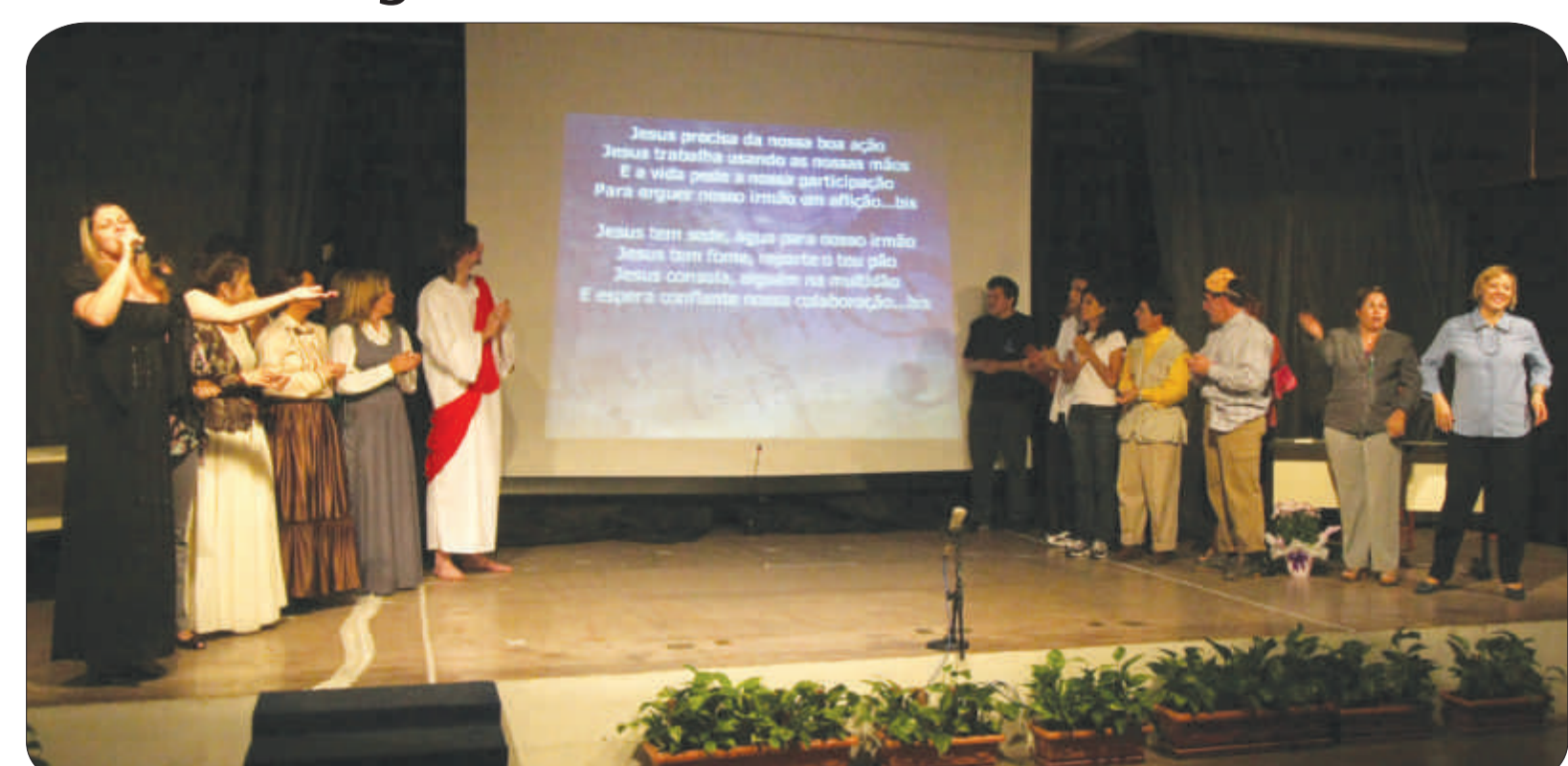
Grupos das fases 2C e 2D, voluntários e moradores da Fraternidade Assistencial Lucas Evangelista (FALE)

A aula inaugural da Diretoria de Estudos Doutrinários (DED) aconteceu no último Domingo de julho, no auditório Bezerra de Menezes. Além de ter sido transmitida pela TV CEI, contou com a apresentação da peça "Jesus trabalha usando as nossas mãos".