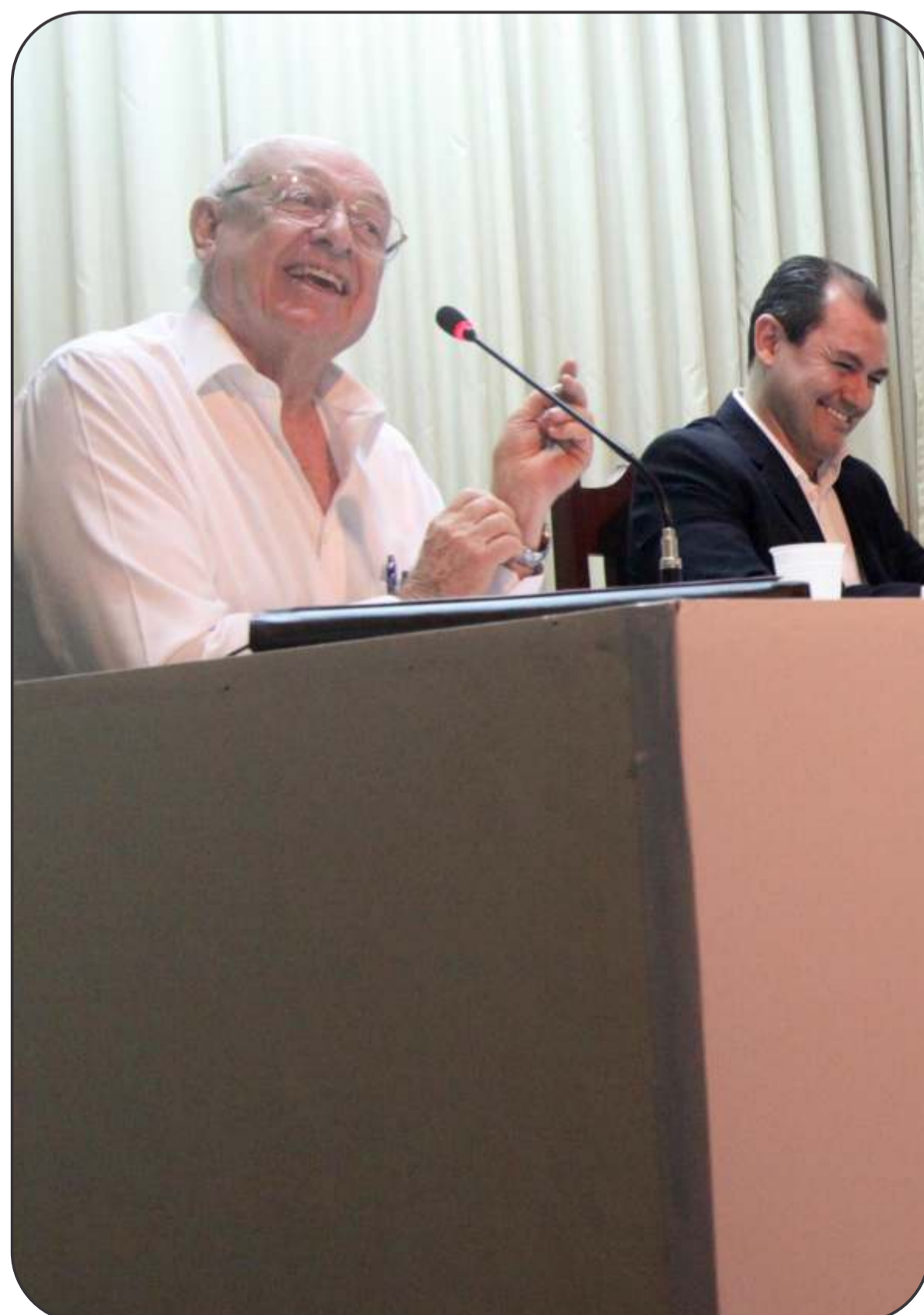
No dia 15 de novembro, a Comunhão promoveu o Cine Debate sobre o filme Irmão Sol Irmã Lua. A obra de Franco Zeffirelli foi analisada por dirigentes espíritas no salão Bezerra de Menezes.

As aulas da infância (de 4 a 14 anos) são ministradas em dois turnos: das 14h30 às 15h30 e das 15h45 às 16h45. Para a turma da juventude (15 a 18 anos), as aulas vão das 14h30 às 16h45, sendo um período de aulas e outro de atividades práticas..