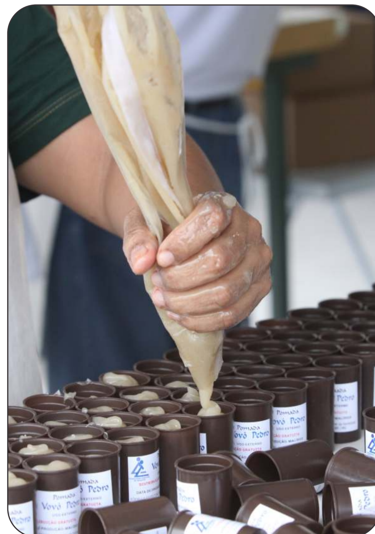
Cerca de 170 voluntários reuniram-se nos dias 9 e 10 de novembro, na Comunhão, para a produção da pomada Vovô Pedro em clima de oração e trabalho, totalizando 50 mil potinhos a serem distribuídos.