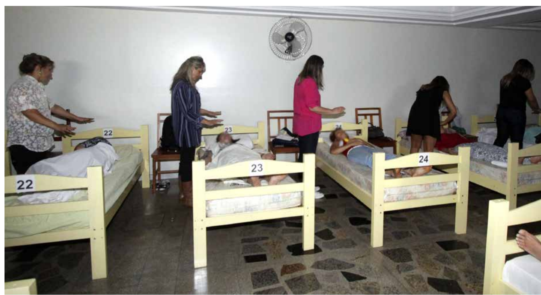
Realidade na Comunhão há décadas, os grupos de tratamento físico-espiritual das salas André Luiz e Chico Xavier funcionam todos os dias às 16h, 18h e 20h. Nas quintas-feiras, às 7h30 e 10h, e, no sábado, às 10h.

O coral Elos de Luz apresenta em 13 de dezembro, às 19h, no auditório Bezerra de Menezes, a tradicional Cantata de Natal. Cerca de 30 integrantes compõem o coro que se dedica a trazer o canto espiritual como forma de harmonização, paz e alegria aos frequentadores da Comunhão. No dia 14, pela manhã, o Elos de Luz levará essa mesma vibração ao Ambulatório de Hanseníase (no Hospital Universitário de Brasília/HUB, na L2 Norte) e, às 19h, se reúne com outros grupos para a Cantata do Grande Coro Espírita do Distrito Federal, na Escola de Música de Brasília, na L2 Sul.