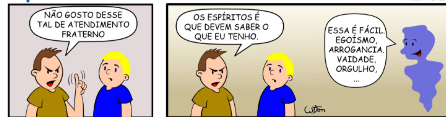
78 - ATENDIMENTO FRATERNO