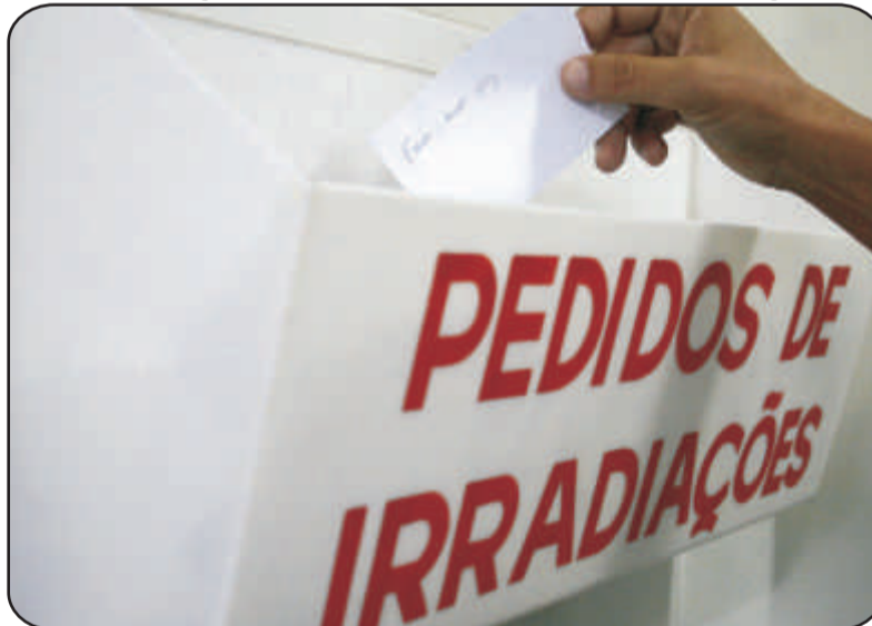
Pedidos deixam de ser feitos em papéis individuais

A partir deste mês, a irradiação obedecerá a novas regras na Comunhão Espírita. A atividade – definida como a emissão de energias de paz, amor e harmonia, inspiradas na prática do Evangelho à luz da Doutrina Espírita, em favor de encarnados e desencarnados – não será mais solicitada pelos frequentadores da Casa em papéis individuais. Em pontos estratégicos e tradicionais, como a entrada da Comunhão e o auditório Bezerra de Menezes, os atendentes agora estão orientados a ajudar as pessoas no preenchimento de uma ficha que solicita o nome completo, além do endereço e da idade (no caso de encarnados) ou cidade e data (para desencarnados). É importante que as pessoas preencham os pedidos de forma completa e com letra legível.