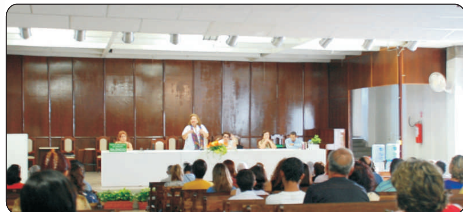
Banco de palestrantes da Comunhão é composto por 90 voluntários, que se revezam durante os sete dias da semana

As palestras proferidas na Comunhão são escolhidas com base em sugestões de frequentadores da Casa, e de assuntos que foram destaque no serviço de orientação e na Ouvidoria. O banco de palestrantes da Comunhão é formado por 90 voluntários, que se revezam durante os sete dias da semana, alguns deles com até quatro palestras diárias.