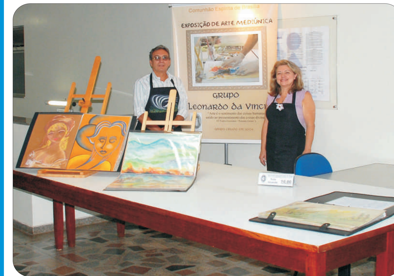
Obras são apresentadas por integrantes do grupo mediúnico Leonardo da Vinci

Em 2004, alguns integrantes de um grupo mediúnico da Comunhão decidiram por unir o mundo físico e espiritual através da arte. Formaram então um subgrupo chamado Leonardo da Vinci, voltado exclusivamente para esse trabalho, em que espíritos que foram pintores na terra são auxiliados por médiuns para pintar telas.