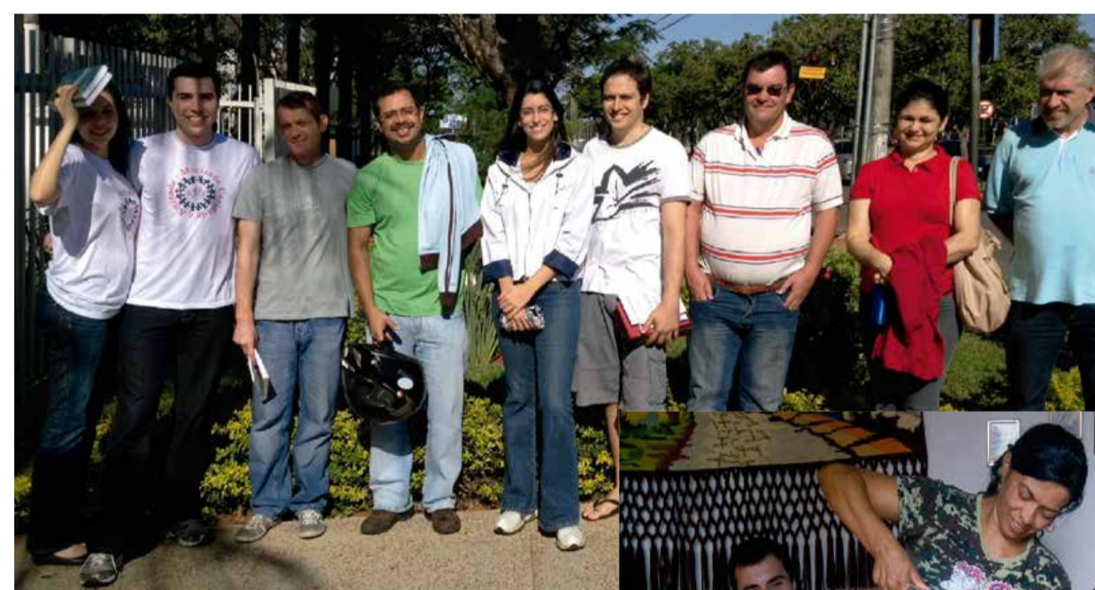
Grupo Auta de Souza sai da Comunhão todo domingo para visitar lares assistidos pela Casa e levar a prática das reuniões

O Grupo Anália Franco entra em contato com os alunos da DED para saber quem deseja a visita. Vai à casa normalmente uma única vez e realiza o Evangelho. Mais informações