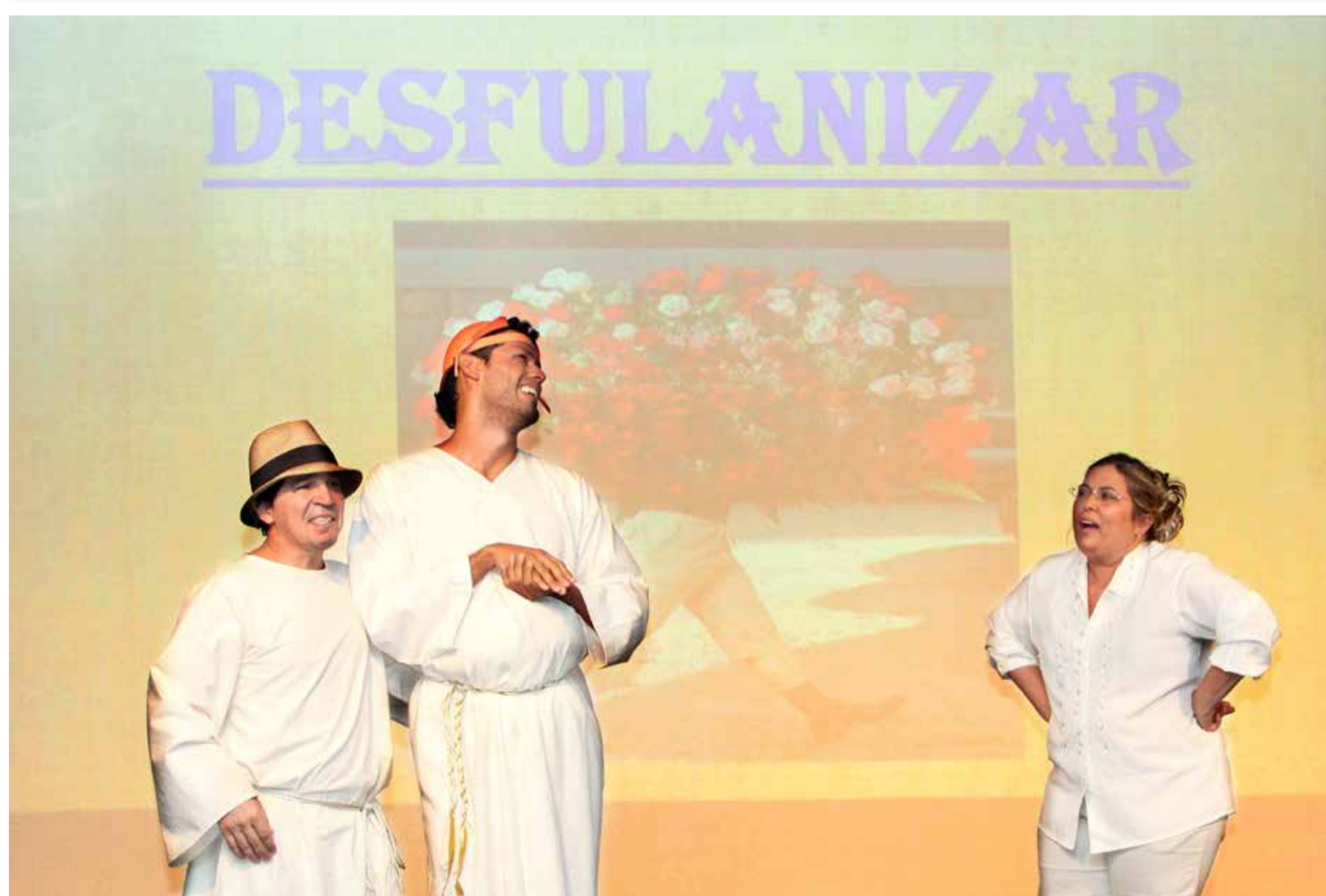
O Grupo de Teatro Vida (GTV) e a Diretoria de Promoção Social (DPS) se juntaram para apresentar a peça "Jesus trabalha usando nossas mãos". O evento aconteceu no dia 27 de setembro, no Auditório Bezerra de Menezes da Comunhão.